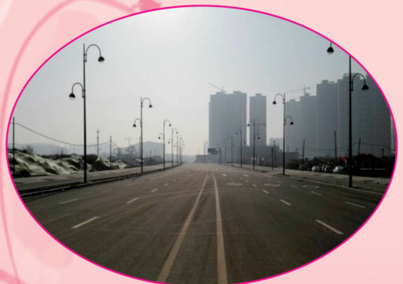
健康西路道排工程