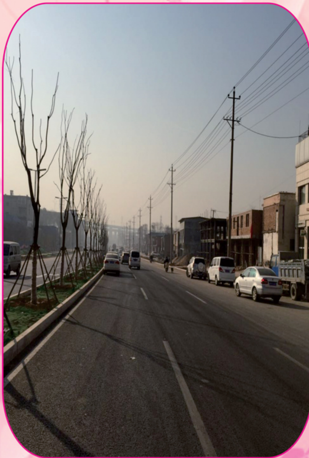
卧虎山快速化改造工程