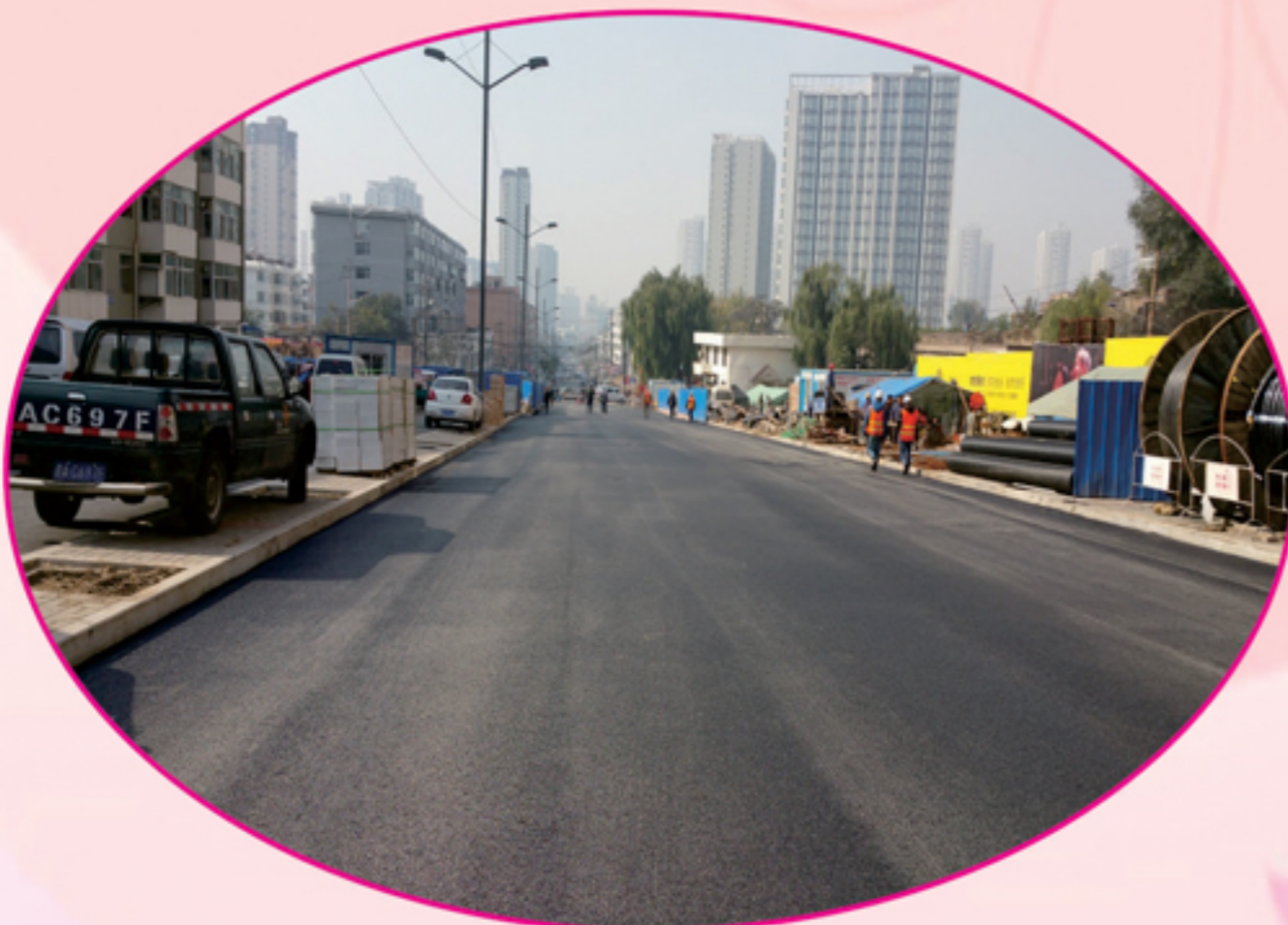
大东关街道路建设工程