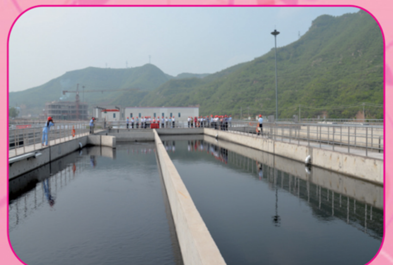
阳泉污水处理厂二期工程