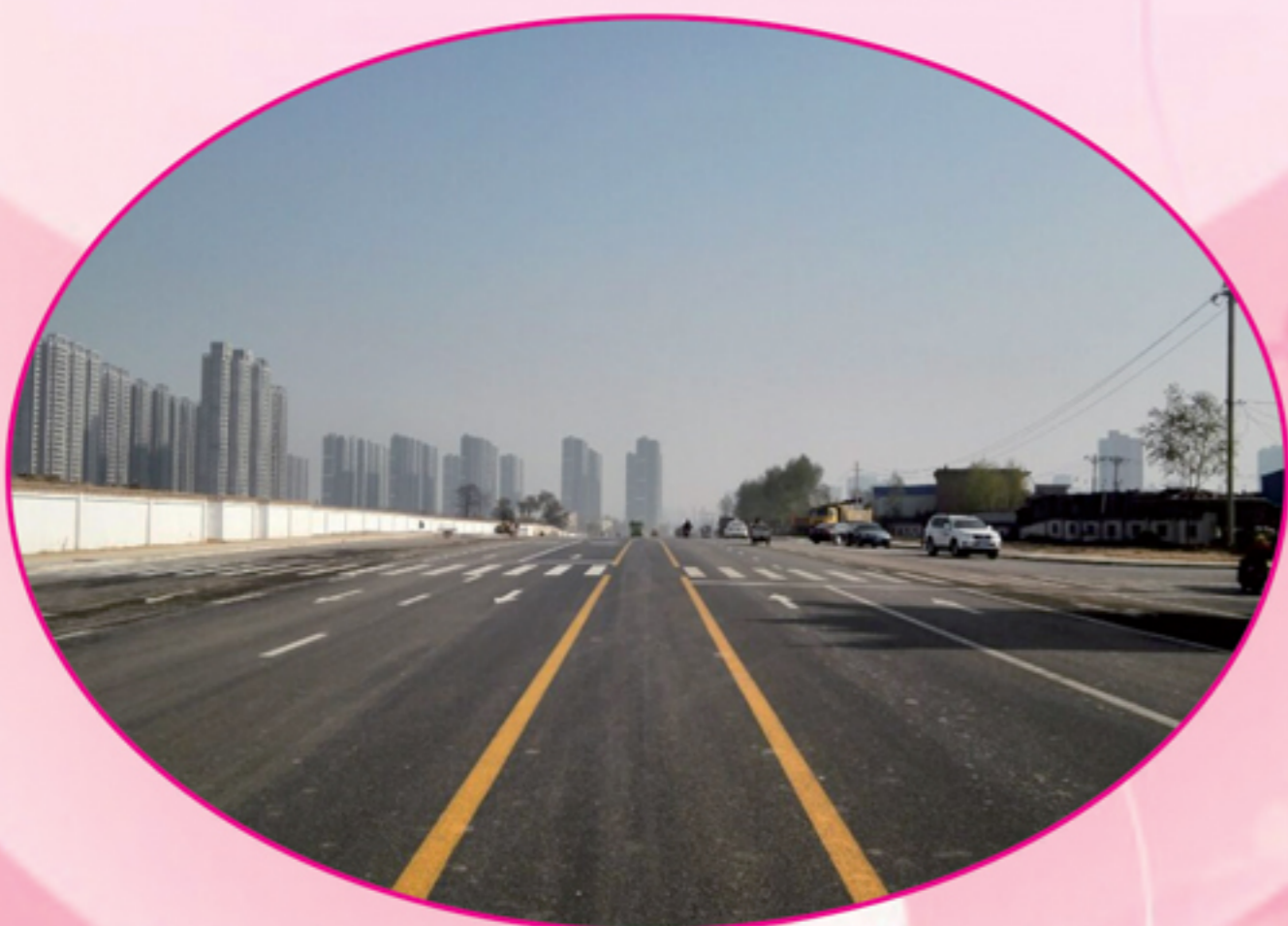
西外环西延道路工程