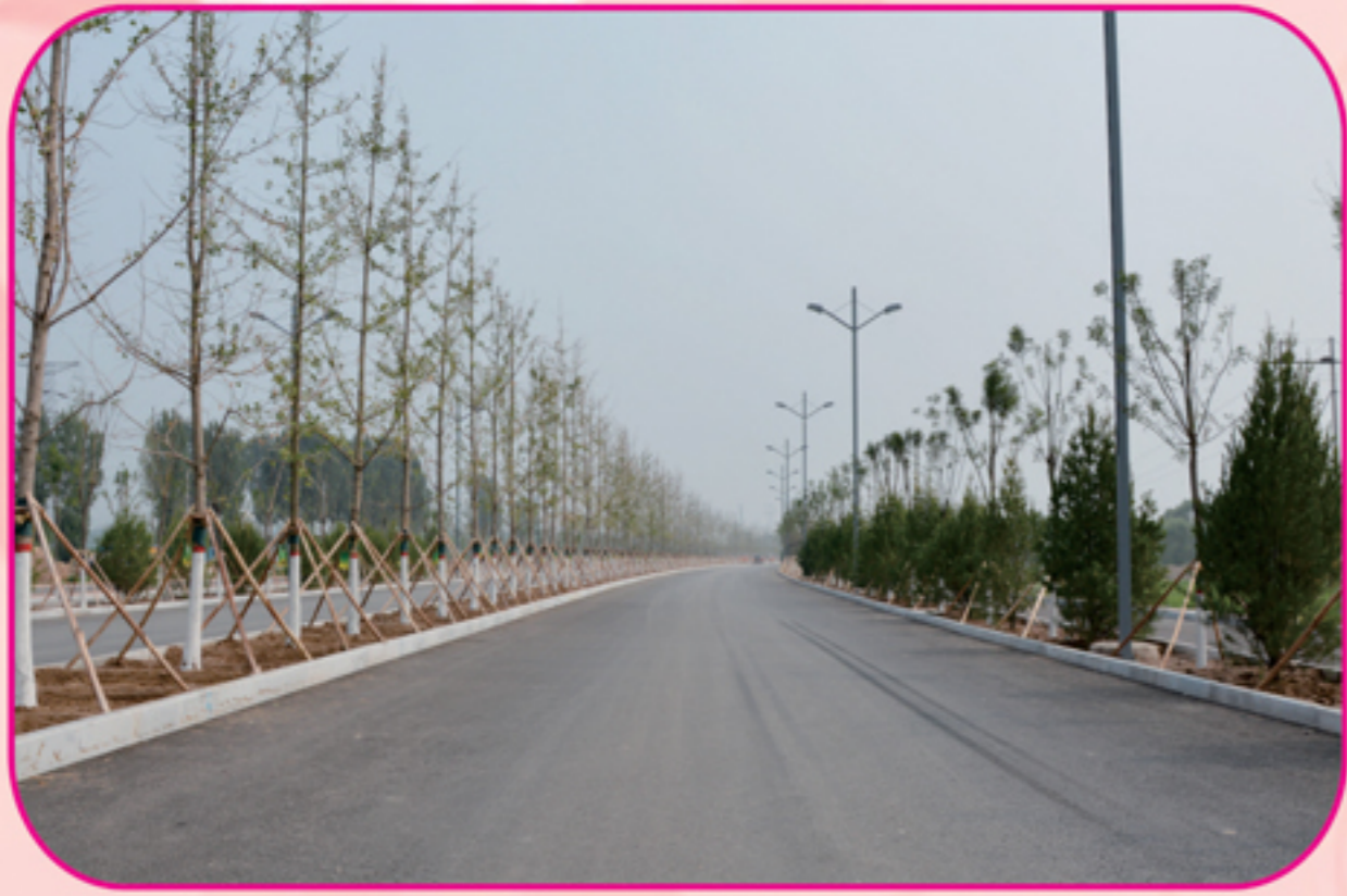
滨河西路南延道路工程

编者按： 2016年，总公司以质量和安全文明施工为抓手，以打造“速度工程、质量工程、安全工程、廉洁工程”为目标，广大干部职工面对工期紧、工程任务重的形势，发扬市政人“召之即来、来之能战、战之能胜”的铁军精神，圆满完成了滨河西路南延道路工程、太茅路道路工程、双塔西街与滨河东路节点改造工程、阳泉污水处理厂二期工程等市内外28项工程，向上级领导和广大市民交上了一份满意的答卷。本版精选部分完工工程图片与大家共同分享。