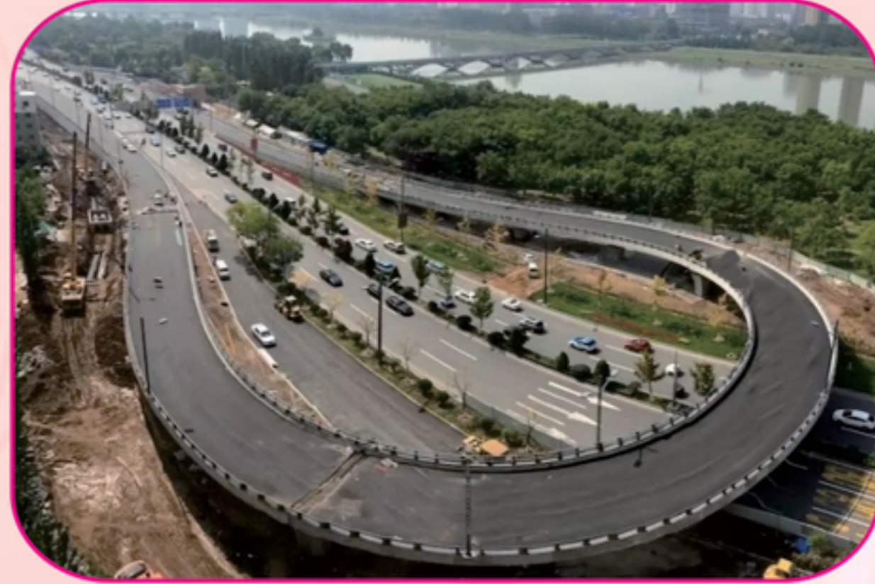
双塔西街与滨河东路节点改造工程