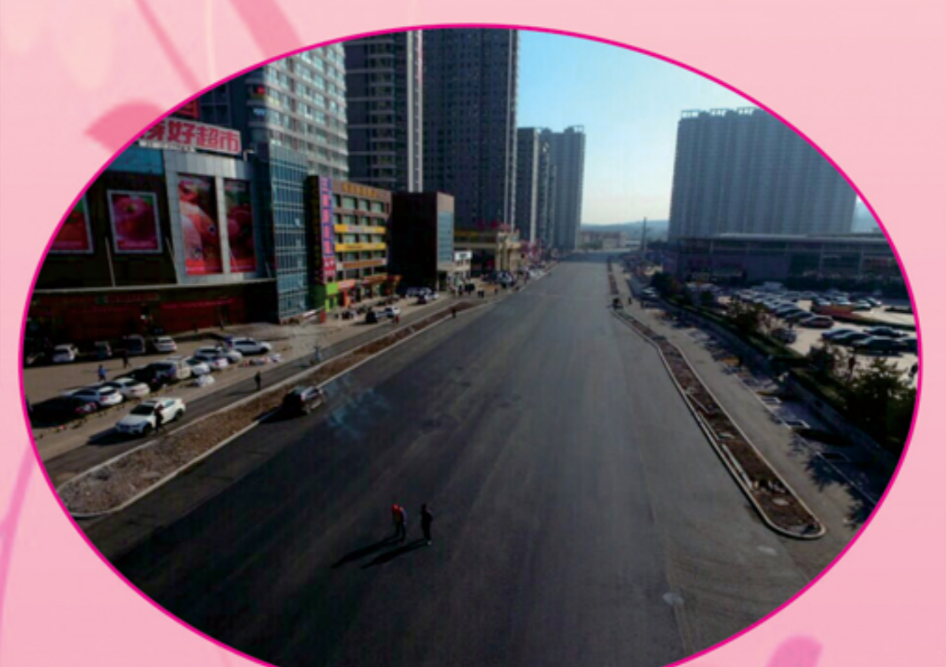
普国路道路改造工程